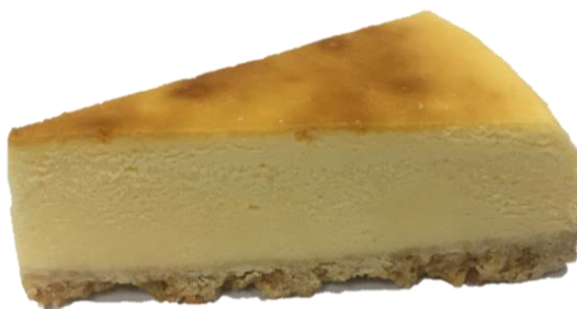
ฐานแครกเกอร์มีรอยแตก