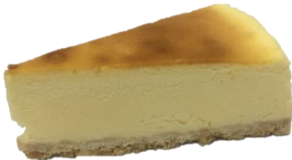
มุมสามเหลี่ยมปลายชั้นมีรอยแห้งไม่เกิน 1 ซม.

3. ลักษณะที่สามารถยอมรับได้ (Accepted) (ต่อ)