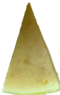
พบรอยแตกที่ขอบด้านหลังของเค้ก

พบจุดสีน้ำตาลเข้มบนผิวหน้าชีสเค้ก เนื่องจากกระบวนการอบที่มีการใช้ความร้อนส่งผลให้ครีมชีสเดือดเห็นเป็นจุดฟองอากาศสีน้ำตาลเข้ม