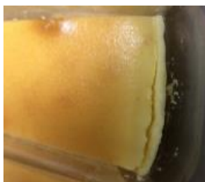
หน้าชีสเค้กร้า