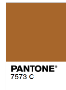
Rejected (Too Dark)