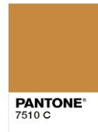
Rejected (Too Dark)