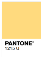
Rejected (Too Light)